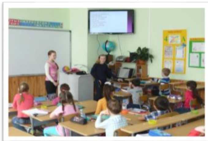
Акция для воспитанников ДОУ на курсах предшкольной подготовки в рамках «Недели детской книги»