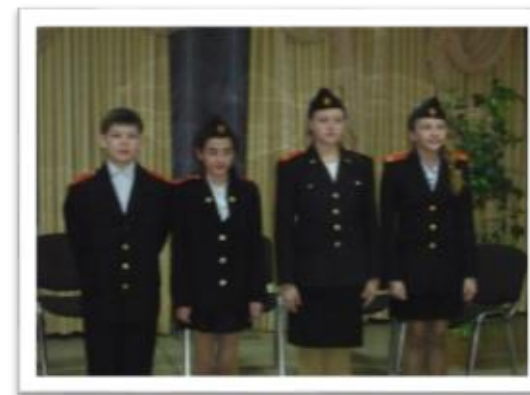
Театрализованная постановка повести Б.Васильева «А зори здесь тихие»