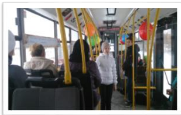
Социально значимая акция «Читающий автобус»