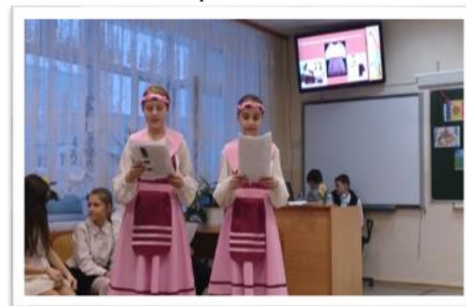
Погружение в литературно-историческую эпоху