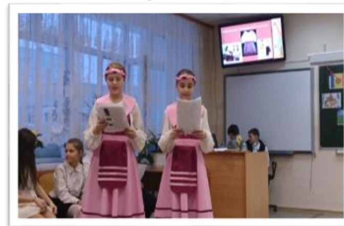
Погружение в литературно-историческую эпоху