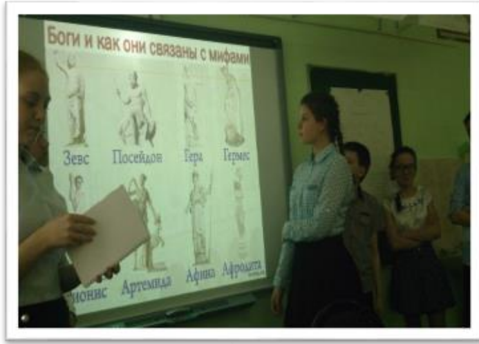
Погружение в литературно-историческую эпоху