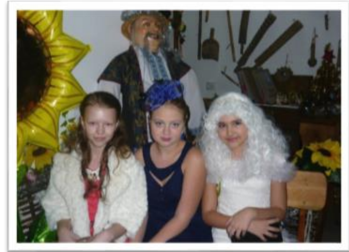
Погружение в литературно-историческую эпоху